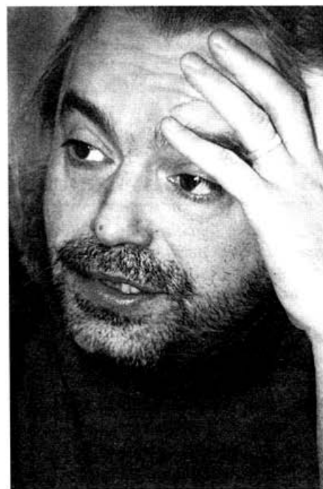
Константин Кинчев: «Через языческую гордыню — к Православию». Стр. 16