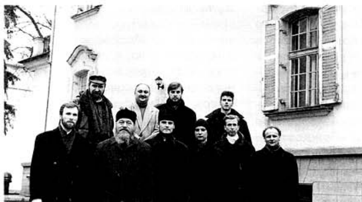
У Русского Культурного Центра в Праге

ры и артисты театров. Сюрпризом для зрителей стало участие в концерте известной киноактрисы Ирины Муравьевой, которая в рождественские дни находилась в Праге. Принял участие в концертах и наш семинарский хор.