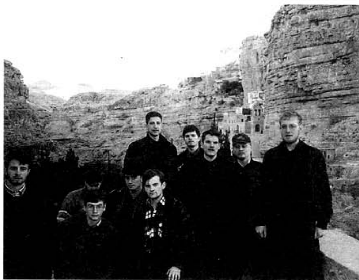
У монастыря преподобного Георгия Хозевита

Самым же сильным впечатлением за всю поездку стало для меня посещение монастыря преподобного Георгия Хо-