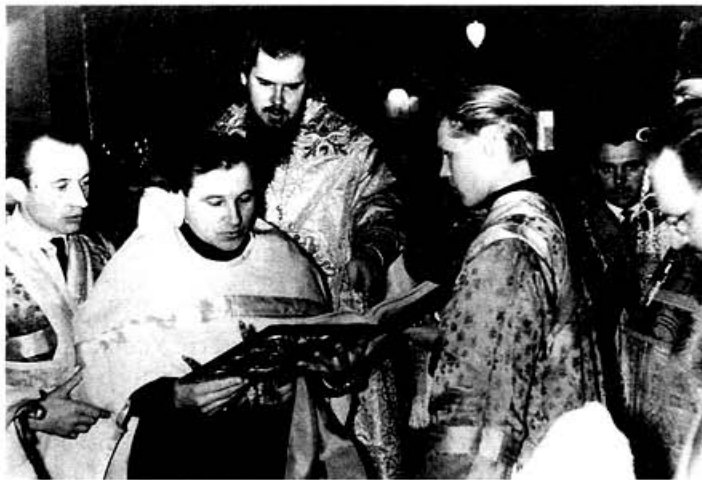
Пострижение во чтеца перед диаконской хиротонией

Овчинников пишет ректору МДАиС протоиерею К.Ружицкому: «В заявлении на имя тов. Н.С.Хрущева Романенко писал: "Хочу прямо сказать, что в попы в наше время я не собираюсь"».