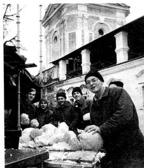
Воспоминания выпускников МДАиС. Стр. 38

На 1-й стр. обложки: «А там что?». Фото Андрея Лисичкина. На 2-й стр. обложки: Интерьер семинарского храма преподобного Иоанна Лествичника. Фото Андрея Лисичкина. На 3-й стр. обложки: Лаврская башня. Фото Сергея Пантелеева. На 4-й стр. обложки: «Православный наставник». Фото Александра Назаренко.