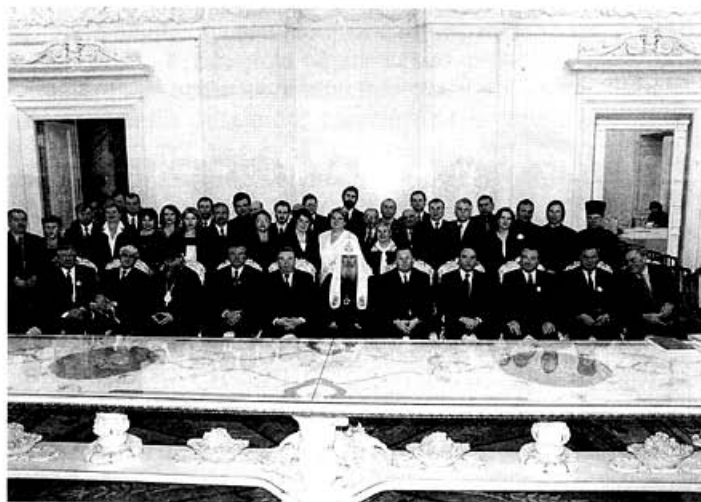
Святейший Патриарх Алексий II среди участников годичного собрания Фонда

Большим событием в жизни православных народов Европы в юбилейный год 2000-летия Рождества Христова стала VII Конференция Европейской Межпарламентской Ассамблеи Православия (ЕМАП), прошедшая с 17 по 20 июня в Иерусалиме.