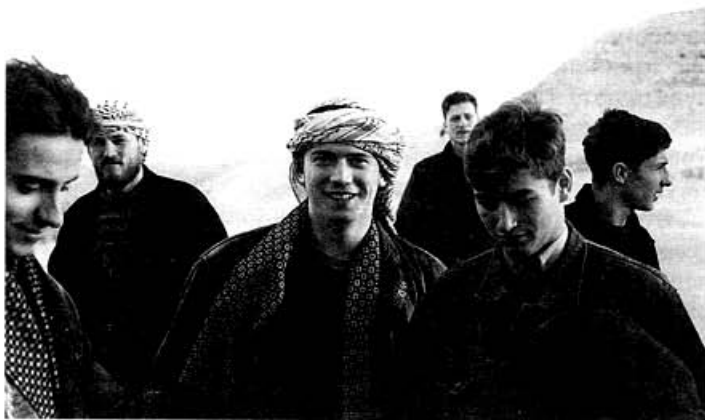
Под палящим солнцем Иудейской пустыни