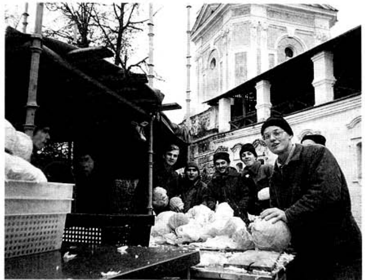
На заготовке капусты

Что касается учебы, то были введены новые предметы, например, риторика.