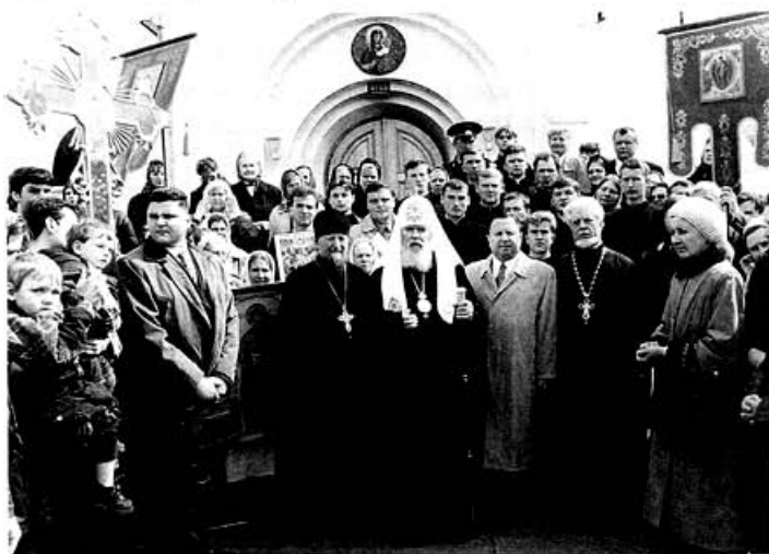
Участники Крестного Хога со Святейшим Патриархом Московским и всея Руси Алексием II

В целях укрепления православного единства в юбилейный год 2000-летия христианства и в память о павших воинах в канун пятьдесят пятой годовщины Великой Победы над фашистской Германией, прошел Крестный ход по полям бывших боевых сражений. Этот памятный Крестный ход, организованный Международным фондом единства православных народов по благословению Святейшего Патриарха Алексия II — Председателя Попечительского Совета Фонда, начался 2 мая в праздник Иверской иконы Божьей Матери с молебна в Киево-Печерской лавре. Далее первым важным этапом на его пути стала Брянская область, где возле креста, установленного на границе России, Украины и Беларуси, состоялся молебен об укреплении единства всего народа Великой, Малой и Белой Руси. Затем был Минск, пополнивший состав участников Патриаршего Памятного Крестного хода священниками и студентами-семинаристами. И наконец, утром 6 мая, в день