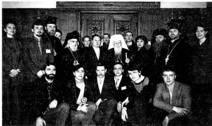
На приеме у Патриарха Болгарского Максима

18–20 марта 2000 года в столице Болгарии Софии состоялась Балканская встреча «Православная молодежь в XXI веке». На встречу, организованную Международным Фондом единства православных народов и его Болгарским Представительством, съехались более тридцати участников из десяти стран Европы, СНГ и Балтии. На этом форуме они представляли политические, религиозные и общественные организации, духовные и светские учебные заведения своих стран. Святейший Патриарх Московский и всея Руси Алексий II, который возглавляет Попечительский Совет Фонда, и Святейший Патриарх Болгарский Максим благословили проведение Балканской встречи и направили свои приветствия его участникам и организаторам. А тот факт, что это событие привлекло внимание политических деятелей и руководства многих стран удвоил надежды и желания участников более активно и результативно работать на этом форуме. Делегаты получили приветствия от Председателя Государственной Думы РФ Г.Селезнева, Председателя Болгарского парламента И.Соколова и других руководителей государств Восточной Европы.