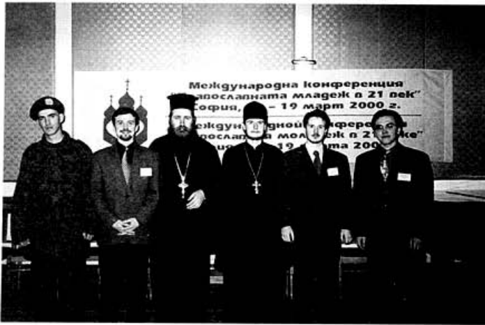
Участники молодежной встречи

тельности Европейской Межпарламентской Ассамблеи Православия, где политические и общественные деятели из 16 государств Европы авторитетно заявили о своей поддержке канонических церковных структур Молдовы, что, безусловно, повлияло на благоприятную для Церкви политику Президента и Правительства Молдовы.