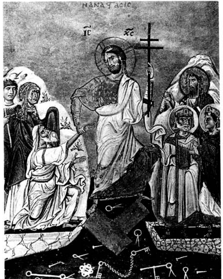
Миниатюра из Евангелистария XI в. Афон

1. Возлюбленные, в последней проповеди, насколько могу судить, я надлежащим образом убедил вас участвовать в кресте Христовом, чтобы сама жизнь верующих имела в себе пасхальное таинство и прославлялось нравами то, что почитается на празднике. А насколько это полезно, вы испытали сами и благодаря своему самопожертвованию узнали, какую пользу доставляют душе и телу продолжительные посты, частые молитвы и щедрые милостыни. В самом деле, нет, пожалуй, никого, кто не получил бы пользу от этого упражнения и не приобрел бы в глубине своей души нечто такое, о чем он по праву мог бы порадоваться. Но это достояние следует хранить с неусыпной строгостью, чтобы из-за ослабления наших